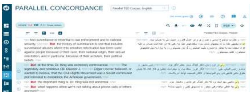
تصویر ۲. واژه but به عنوان نمونه و ترجمه آن در خطوط واژه‌نما در پیکره