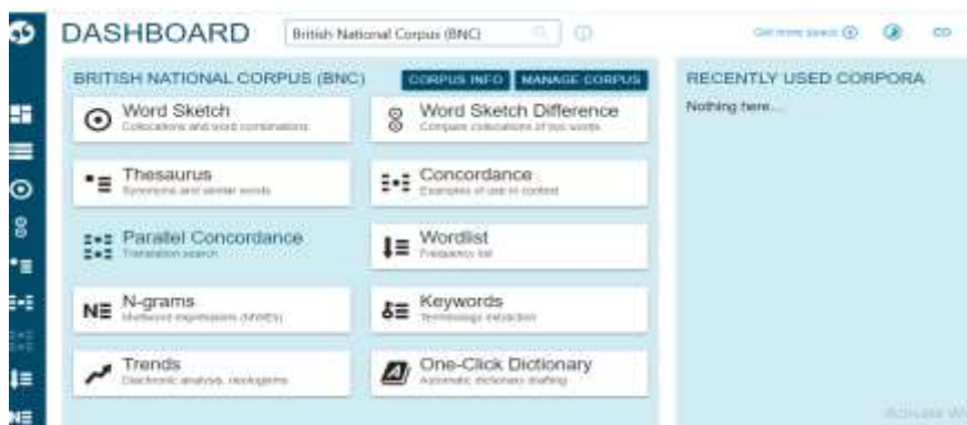
تصویر ۱. محیط نرم‌افزار زبان‌شناسی پیکره‌ای اسکچ انجین

جفت فارسی و انگلیسی هنوز خیلی قابل اتکا نیست. حجم کلی این پیکره بالغ بر ۴۳۰۰۰ کلمه است که اطلاعات دقیق آن در جدول ۲ قابل مشاهده است. برای تشکیل پیکره مورد نیاز و انجام تحلیل‌های مورد نظر، نرم‌افزار اسکچ انجین ۱ به کار گرفته شد. این نرم‌افزار که در محیط‌های ویندوز، لینوکس و مک قابلیت کار دارد در ۲۰۰۳ توسط کیل گریف ۲ در جمهوری چک طراحی شد. این نرم‌افزار به صورت تجاری در دسترس است و قابلیت‌های مختلفی از جمله پردازش متون در زبان‌های مختلف، طراحی پیکره‌های دوزبانه و چندزبانه، بررسی‌های گوناگون پیکره‌های و دسترسی آزاد و رایگان به تعدادی از مهم‌ترین و بزرگ‌ترین پیکره‌های دنیاست.