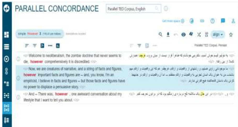
تصویر ۳. واژه however به‌عنوان نمونه و ترجمه آن در خطوط واژه‌نما در پیکره