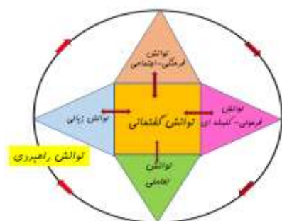
شکل ۱. مدل اصلاحی توانش ارتباطی سلسه-مورسیا

سلسه-مورسیا، دورنیه و ترل ۱ در ۱۹۹۵ برای طراح برنامه درسی ارتباط‌محور، مدلی پیشنهاد کردند که هدفش آموزشی کاربردی و پاسخ به نیاز به مدلی جامع و در برگیرنده تمامی ویژگی‌های توانش ارتباطی بود (سلسه-مورسیا، ۲۰۰۷). سلسه مورسیا که در سال ۲۰۰۵ مدل اصلاح شده‌ای ارائه کرد (شکل ۱) این بار تأکید اصلی‌اش بر نقش گفتمان و بافت بود و توانش ارتباطی را متشکل از شش نوع توانش گفتمانی، اجتماعی فرهنگی، کلیشه‌ای، تعاملی، زبانی و راهبردی می‌دانست. این مدل‌ها علی‌رغم جامع تر بودن از مدل‌های پیشین چندان مورد توجه قرار نگرفتند.