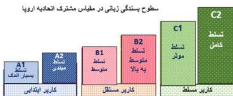
نمودار ۱. سطح‌بندی بسندگی زبانی در مقیاس مشترک اتحادیه اروپا