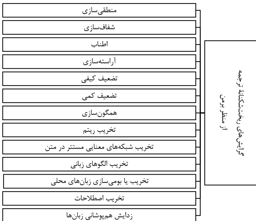
نمودار ۱. گرایش‌های ریخت‌شکنانه ترجمه از منظر برمن

برمن در توضیح مؤلفه «شفاف‌سازی» ۱ می‌گوید: