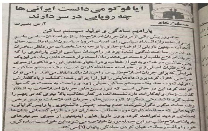
شکل ۳. نمونه‌ای از نقد قدرت در دوران اصلاحات

در شکل (۳) نمونه‌ای از نقد قدرت با عنوان «آیا فوکو می‌دانست ایرانی‌ها چه رؤیایی در سر دارند؟» نقدی بر دولت اصلاحات وارد شده است و آن را یک سیستم ساکن که در راه‌بندان مانده است، توصیف می‌کند.