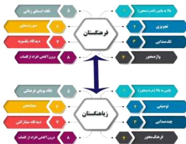
نمودار ۴. بررسی تطبیقی فرهنگستان و زبانهنگستان

زندگی و مکالمات روزمره‌شان کاربردی ندارد و نسبت به این کلمات دارای هیجان‌ات دور ۱ هستند؛ یعنی حتی شنیدن این واژگان هیجان چندانی برای آنان ایجاد نمی‌کند و خود از نزدیک آنها را تجربه نمی‌کنند (پیش‌قدم و ابراهیمی، ۲۰۲۰)؛ اما در زبانهنگستان از آنجایی که زبانهنگ‌ها به واکاوی عبارات زبانی پربسامد مردم یک جامعه می‌پردازند، نسبت به آنها درون‌آگاهی پیدا می‌کنند و این زبانهنگ‌ها نسل به نسل نیز منتقل می‌گردند؛ بنابراین، افراد نسبت به آنها دارای هیجان نزدیک ۲ هستند. باید توجه داشت که برای پذیرش واژگان و فرهنگ‌سازی و حفظ اصالت یک زبان داشتن نگاهی تک‌صدایی، یکسویه و تنها توجه به جنبه رسمی زبان و خط فارسی کفایت نمی‌کند و باید افراد جامعه را نیز در این مهم مشارکت داد که زبانهنگستان با دیدی مشارکتی، این امر را میسر می‌سازد. نگاه چندصدایی و به‌کارگیری ظرفیت اکثر آحاد جامعه باعث هم‌افزایی و همدلی می‌شود و انگیزه مشارکت و فعالیت را نیز افزایش می‌دهد. با توجه به آنچه بیان شد، تفاوت زبانهنگستان و فرهنگستان را می‌توان در نمودار (۴) به تصویر کشید: