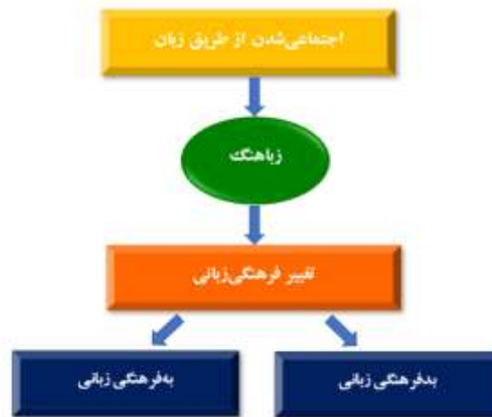
نمودار ۳. تغییر فرهنگی از طریق زبان

به طور کلی با توجه به نمودار (۳)، نوع زبانگ‌های رایج در گفتمان گویشوران هر جامعه در تغییرات زبانی-فرهنگی آن جامعه مؤثر است؛ بنابراین شایسته است کنشگران محیط اجتماعی کودک اعم از اعضای خانواده و مربیان و معلمان مدارس، در به‌کارگیری زبانگ‌ها حساسیت بیشتری داشته باشند و از به‌کارگیری زبانگ‌هایی که ترویج‌کننده فرهنگ نادرست در جامعه است پرهیز نمایند؛ زیرا بر اساس اصل پروانه‌ای ۱ نظریه آشوب کوچک‌ترین تغییر می‌تواند خیل عظیمی از تغییرات را ایجاد کند (پیش‌قدم، طباطبائی و ناوری، ۱۳۹۲). از این رو ممکن است به کار بردن یک زبانگ نادرست موجب ترویج بسیاری از رذیلت‌های اخلاقی و فرهنگی در جامعه شود که این امر خود اهمیت بررسی زبانگ‌ها را روشن می‌سازد.